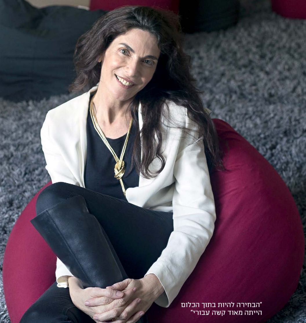
"הבחירה להיות בתוך הכלום הייתה מאוד קשה עבורי"

"לא הייתי אדם פופולרי בשום צורה. תמיד עמדתי על שלי, וזאת לא בהכרח תכונה טובה, כי אם היא לא באה עם גמישות זה בעייתי. אני חושבת שחוויות חברתיות לא טובות בילדות מאפשרות לי להיות היום אמפתית יותר לילדים שקשה להם חברתית"