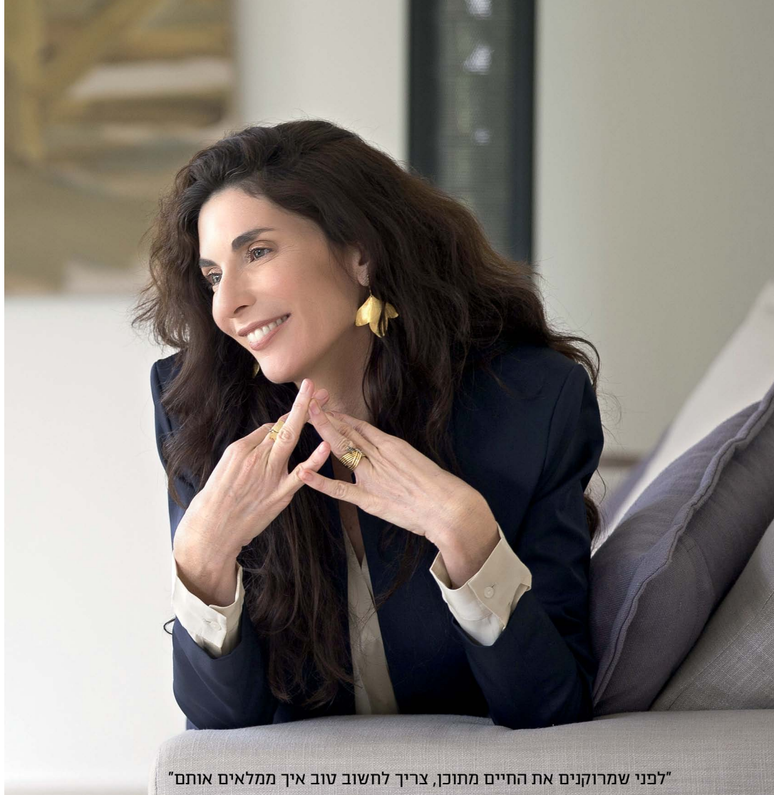
"לפני שמרוקנים את החיים מתוכן, צריך לחשוב טוב איך ממלאים אותם"